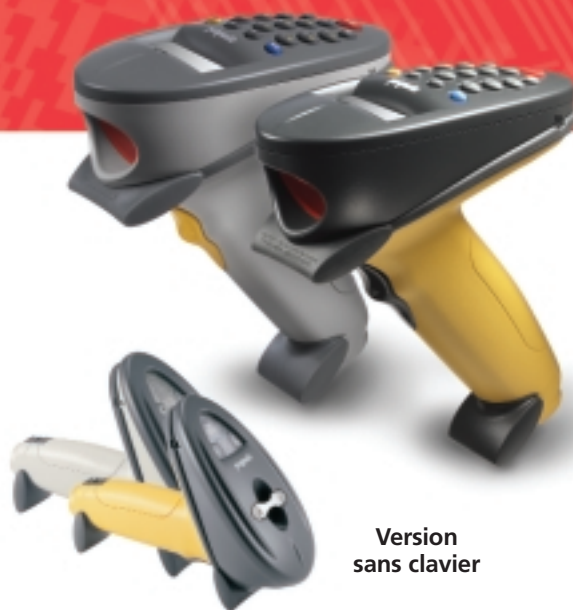
Version sans clavier

Grâce aux lecteurs de codes à barres RF sans fil Phaser P370 et P470, vous pouvez choisir le système le mieux adapté aux besoins de votre application quel que soit l'environnement. Le P370 est parfaitement adapté aux environnements extrêmes, ce qui en fait un outil idéal pour les applications d'entrepôt, de chantier ou de quai de chargement. Et le